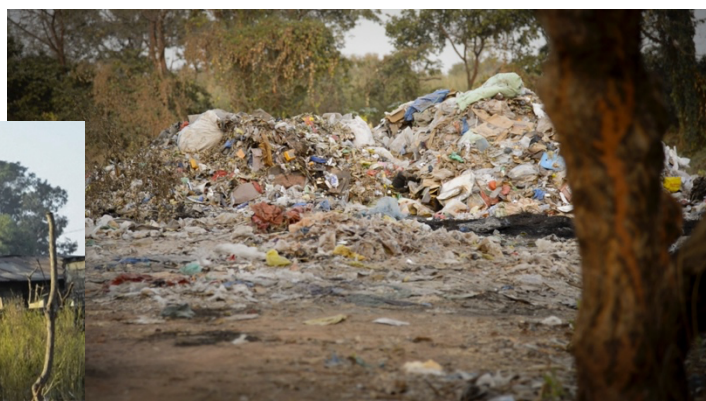
Discarica del comune di Diaroumé