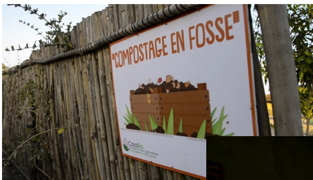
Centro di formazione CasaBio

Raccolta dei rifiuti organici per la produzione di compost e biogas avviata al Centro CasaBio per potenziare la produzione agricola, energetica e lo sviluppo di attività economiche. Il compost sarà utilizzato al posto di fertilizzanti chimici con lo scopo di promuovere attività agricole biologiche nel villaggio.