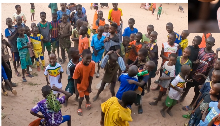
Scuola di Bagadadji